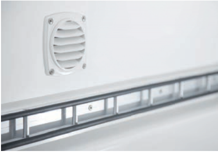
Alu-Stäbchenzurleisten und Druckentlüftung