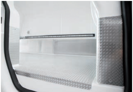
Alu-Boden und Alu-Stoßplatten