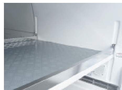
Entnehmbarer Zwischenboden (Sonderausstattung)