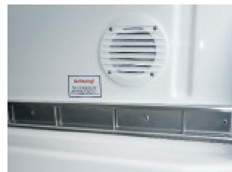
Serienmäßige Druckentlüftung und Zurrleisten aus VA (Sonderausstattung)