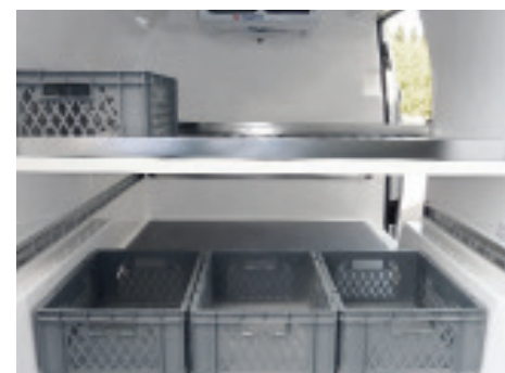
Heckansicht beladen mit E2-Kisten