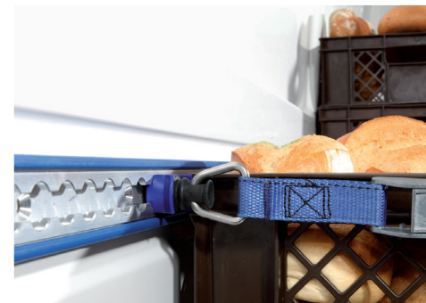
Systemschienen, Ladegutsicherung mit Spanngurten (Sonderausstattung)