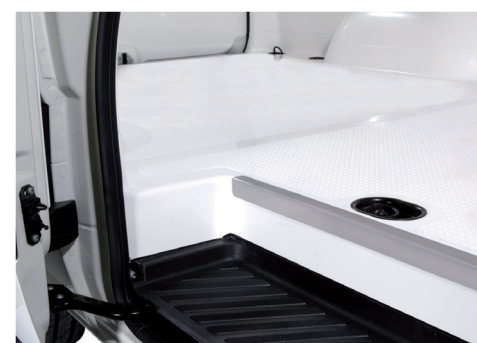
Einstieg mit Edelstahlschiene